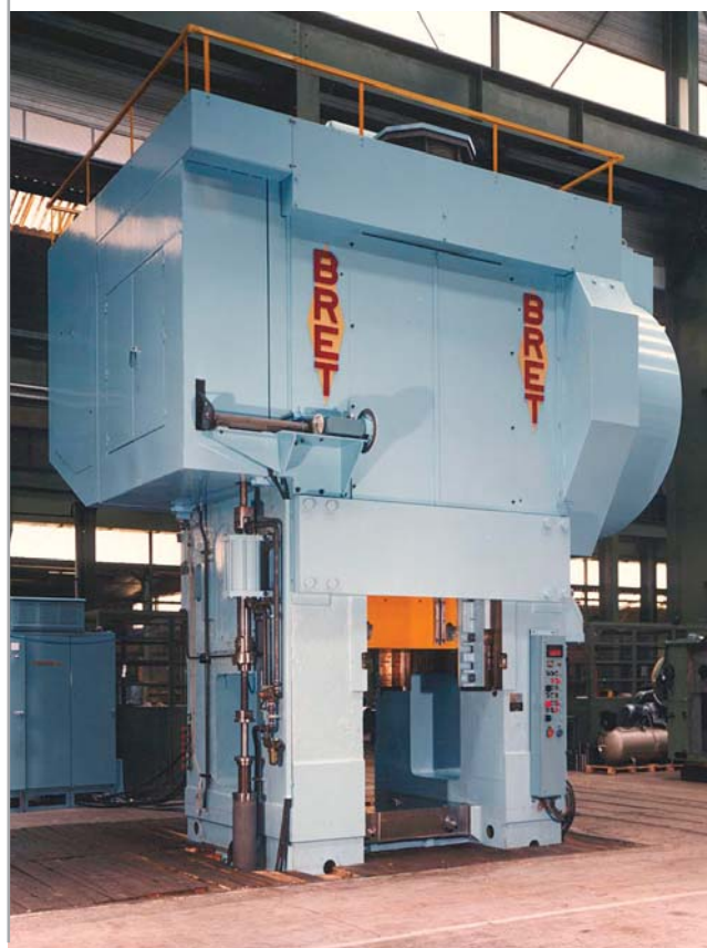
Presse de forge 4 500 tonnes. 4 500-ton forging and die stamping press.