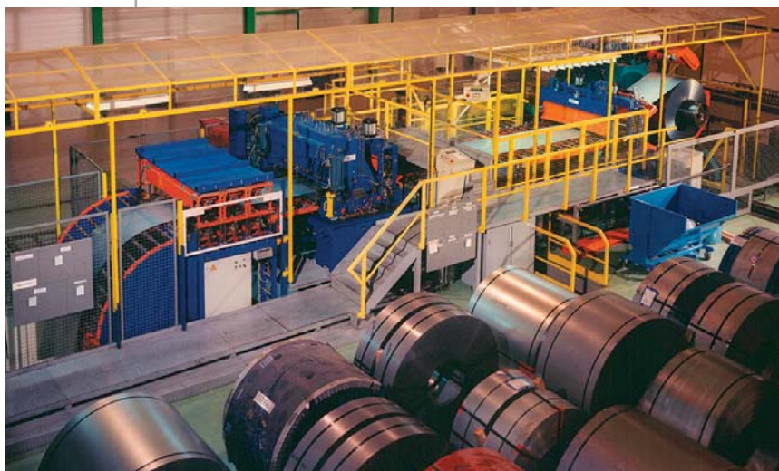
Ligne de déroulage pour bande largeur 2000 mm, épaisseur maxi 3 mm et bobines de 30 tonnes (installée chez un sidérurgiste).

The products we offer suit the needs of the most demanding users. Our lines are installed in factories belonging to the big names in the European automobile and steel industries, as well as at small blanking and drawing firms.